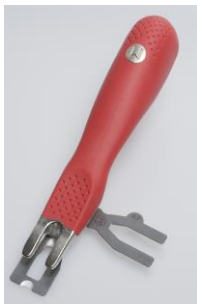
Zum Abstoßen der Schweißschnur empfehlen wir das Mozart Abstoßmesser